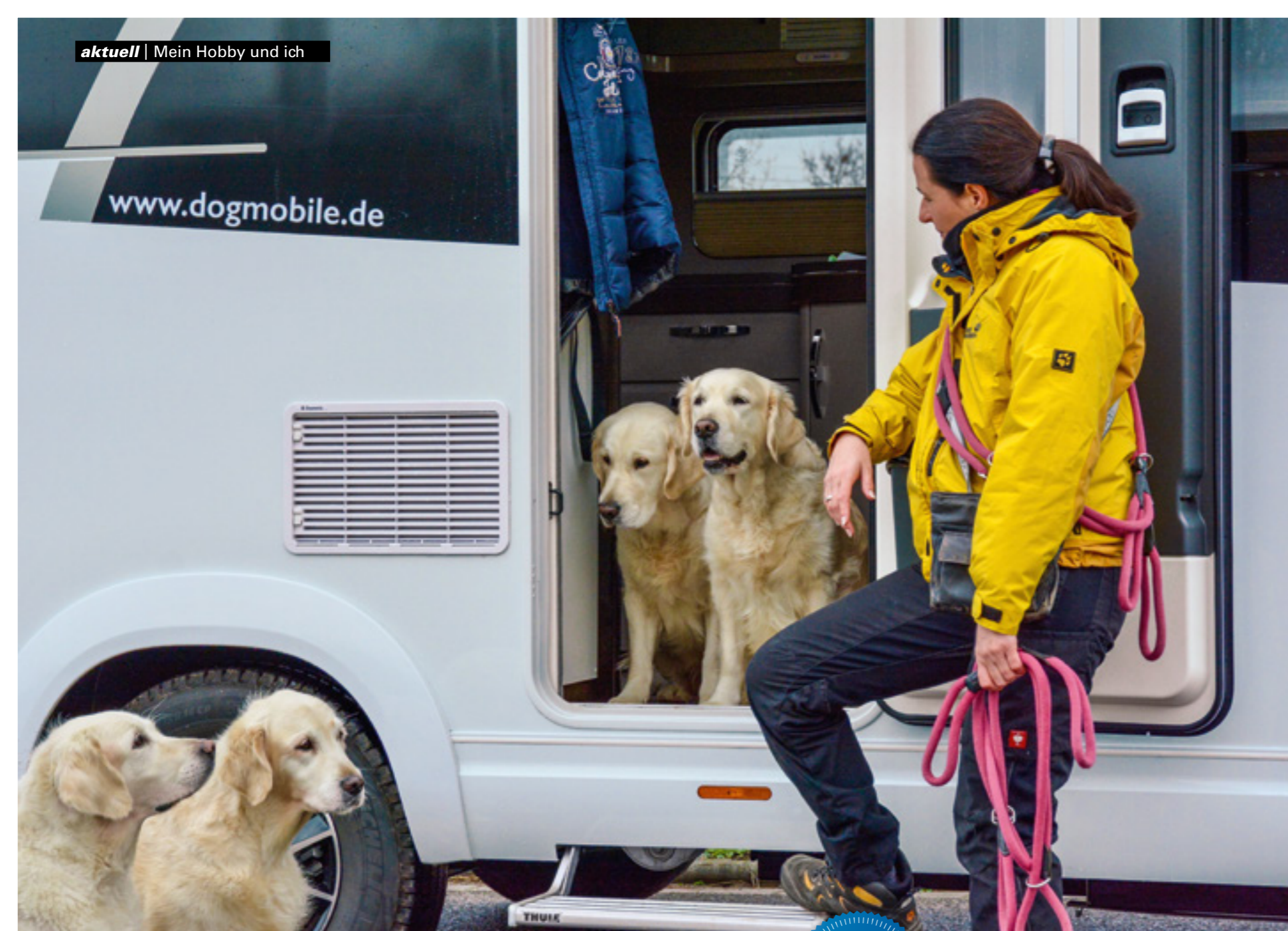
Links: Man sieht es den vierbeinigen Mitreisenden an: Im „Dogmobil“ fühlen sie sich bestens aufgehoben wohl