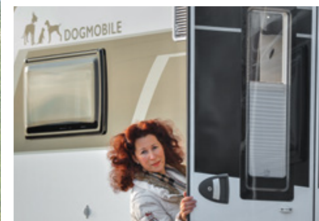
Text: Joachim Kalkowsky